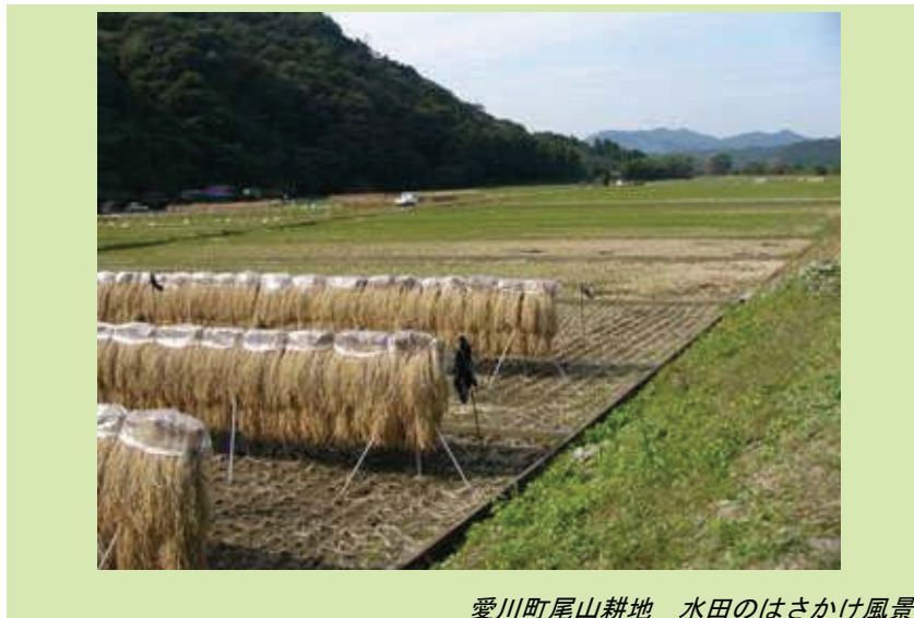
愛川町尾山耕地 水田のはさかけ風景

今年は、「桂川・相模川からのメッセージ ～水質と農薬のかかわり～」というテーマで、参加者が本音で語り合うシンポジウムを開催します。